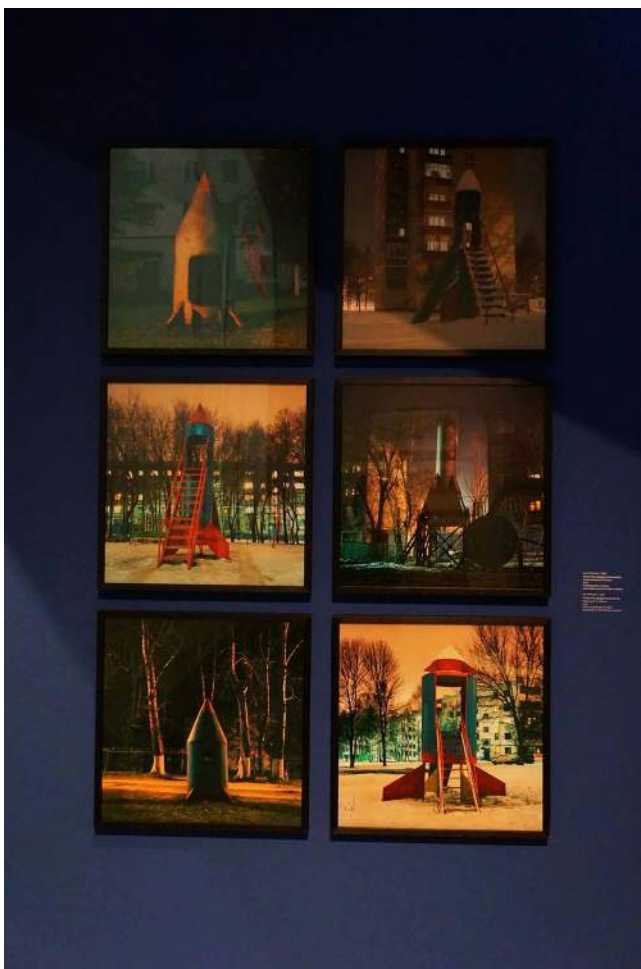
Iwan Michailow, From the playground series , 2010. Toen de Sovjet-Unie de space race won, waren alle Russen in de ban van de ruimte. Naar het schijnt staat heel Rusland vol speeltoestellen die met de ruimtevaart te maken hebben.