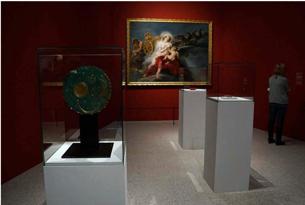
Peter Paul Rubens, De geboorte van de melkweg , 1636-1638