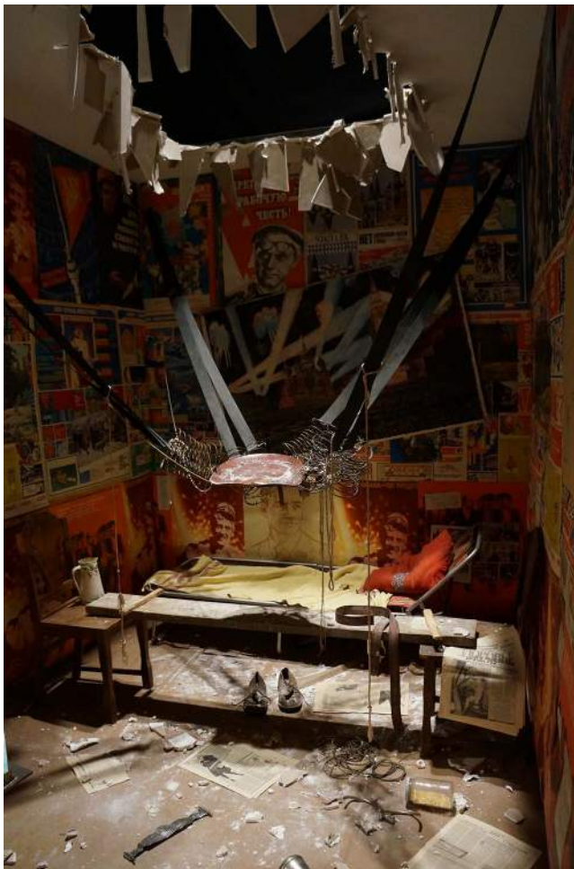
Ilya Kabakov, The man who flew into space from his apartment , 1985