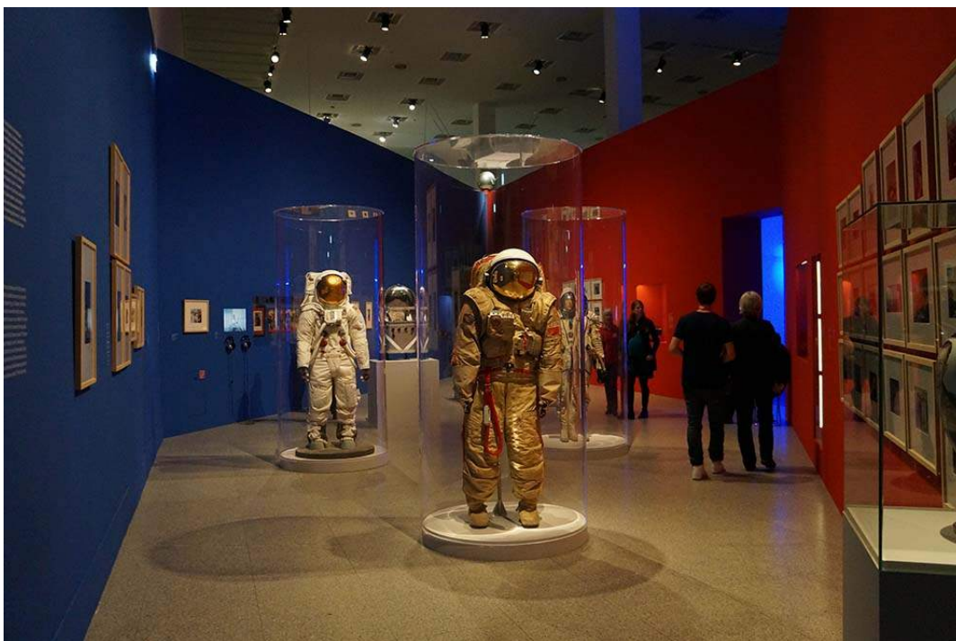
Zaaloverzicht over de space race. De blauwe muur gaat over de Amerikaanse missies, de rode over die van de Sovjet-Unie