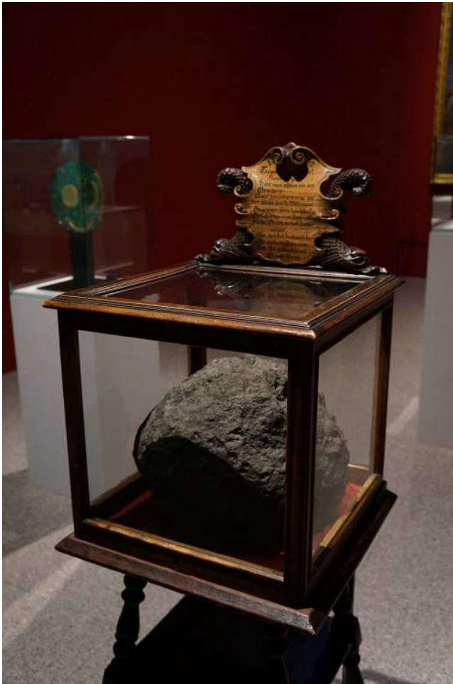
Meteoriet van Ensisheim. Viel op 7 november 1492 ter aarde. De meteoriet was oorspronkelijk veel groter, maar meerdere mensen hebben er stukken af geslagen, als souvenir of voor onderzoek