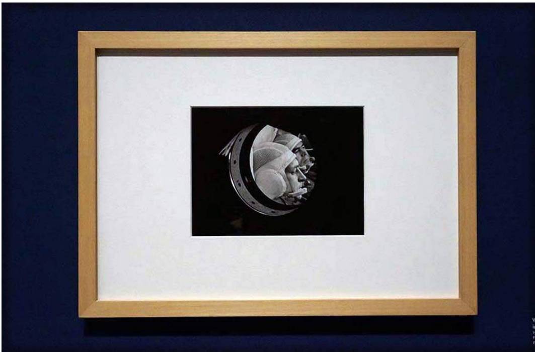
Mooie beeldrijm. Redon hangt naast deze foto van Wirali Sewastjanow en Andrijan Nikolajew in een ruimtecapsule, 1970