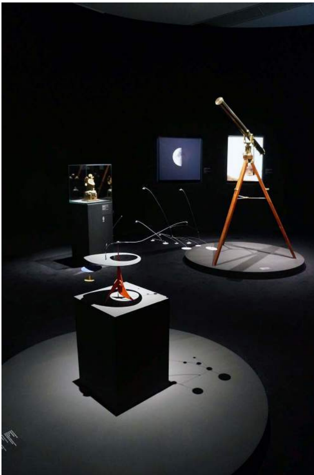
Voorgrond: Alexander Calder, Dansende sterren , 1940/45.