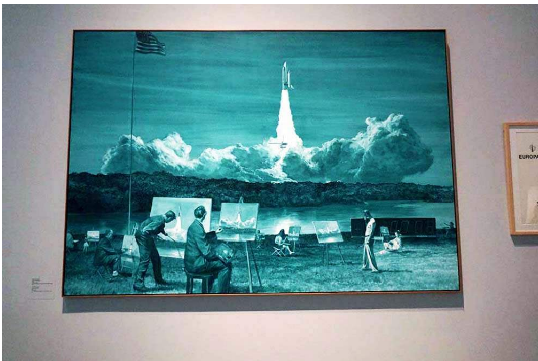
Mark Tansey, Action Painting II , 1984. Als je goed kijkt zie je dat de schilders al klaar zijn voor de raket is opgestegen.