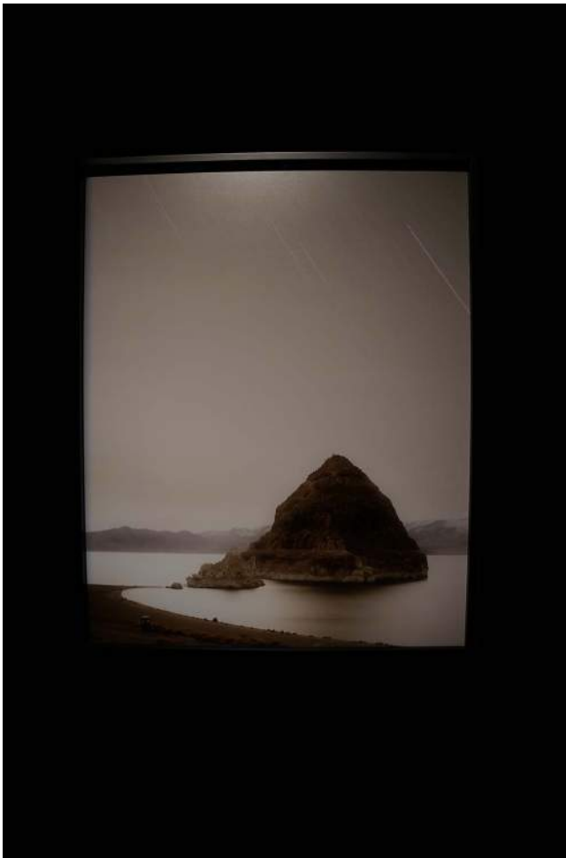
Trevor Paglen, DMSP 5B4F from Pyramid Lake Indian Reservation (Military Meteorological Satellite; 1973-064A) , 2009. Paglen maakt gebruik van Amerikaans surveillancemateriaal.