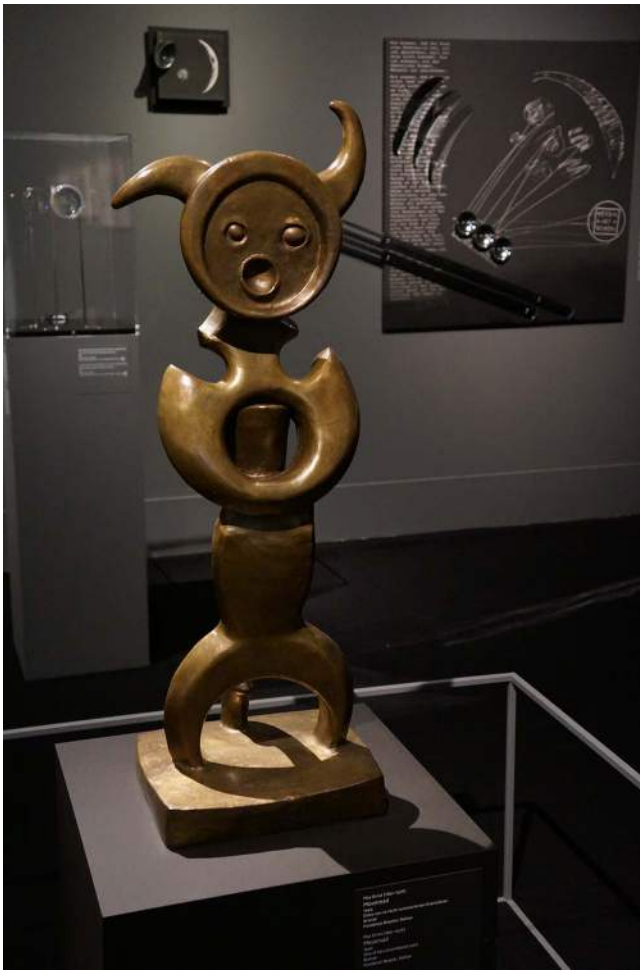
Max Ernst, Moonmad , 1944