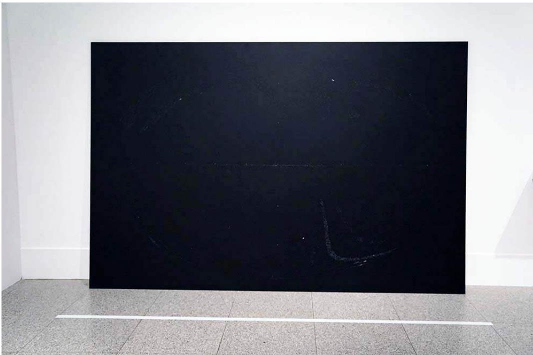
Katie Patterson, All the dead stars , 2009. Een kaart met de locaties van alle 27.000 dode sterren die ooit zijn gezien door mensen.