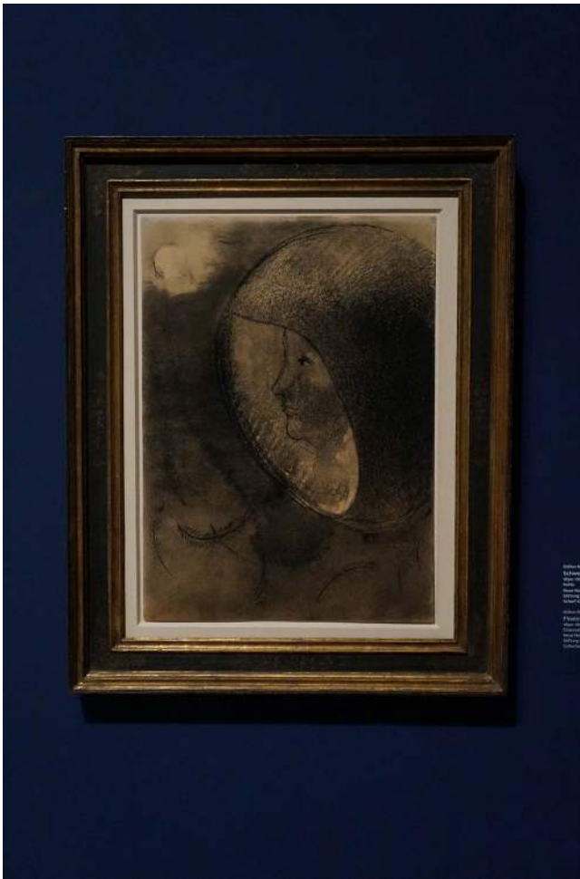
Odilon Redon, Schwebende Kugel mit Frauenprofil , 1890-1895