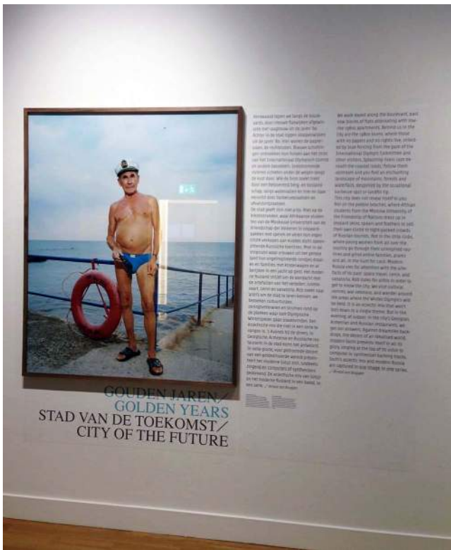
De tentoonstelling is opgebouwd in 'hoofdstukken'