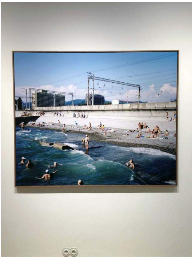
Adler, regio Sotsji, Rusland 2011.