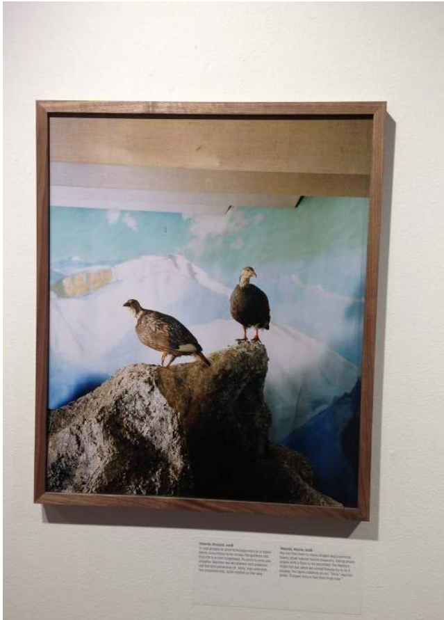
Teberda, Rusland, 2008

dat Hornstra en Van Bruggen vaak precies de mensen vastleggen die over het hoofd gezien worden, of de plekken die de Russen (of de autoriteiten) liever niet laten zien.