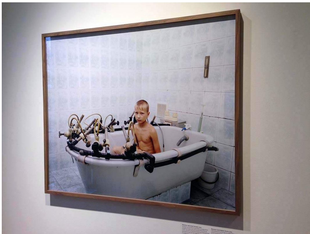
Matsesta, regio Sotsji, Rusland, 2009. Een jongen met brandwonden op zijn benen in een 'magisch zwavelbad' in het sanatorium