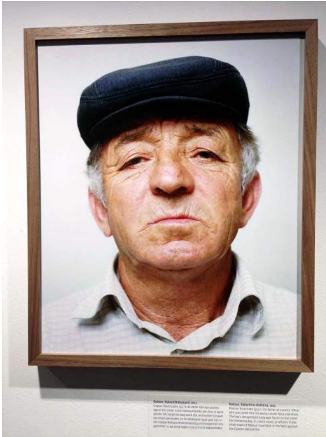
Baksan, Kabardië-Balkarië, 2013.

Maar het wordt pas echt naar bij de portretten, bij de verhalen van gewone mensen. Hornstra fotografeerde bijvoorbeeld een man die stuurs de camera inkijkt. Meer dan levensgroot afgedrukt, en daarom erg 'in your face'. Dan lees je dat de zoon van deze 55-jarige man, een politieagent, onthoofd op straat werd gevonden, slachtoffer van islamitische separatisten. Verbouwereerd kijk je met andere ogen naar de man. Zo gaan de meeste verhalen over verval, hoop en hopeloosheid, mensen die zijn verdwenen of erger.