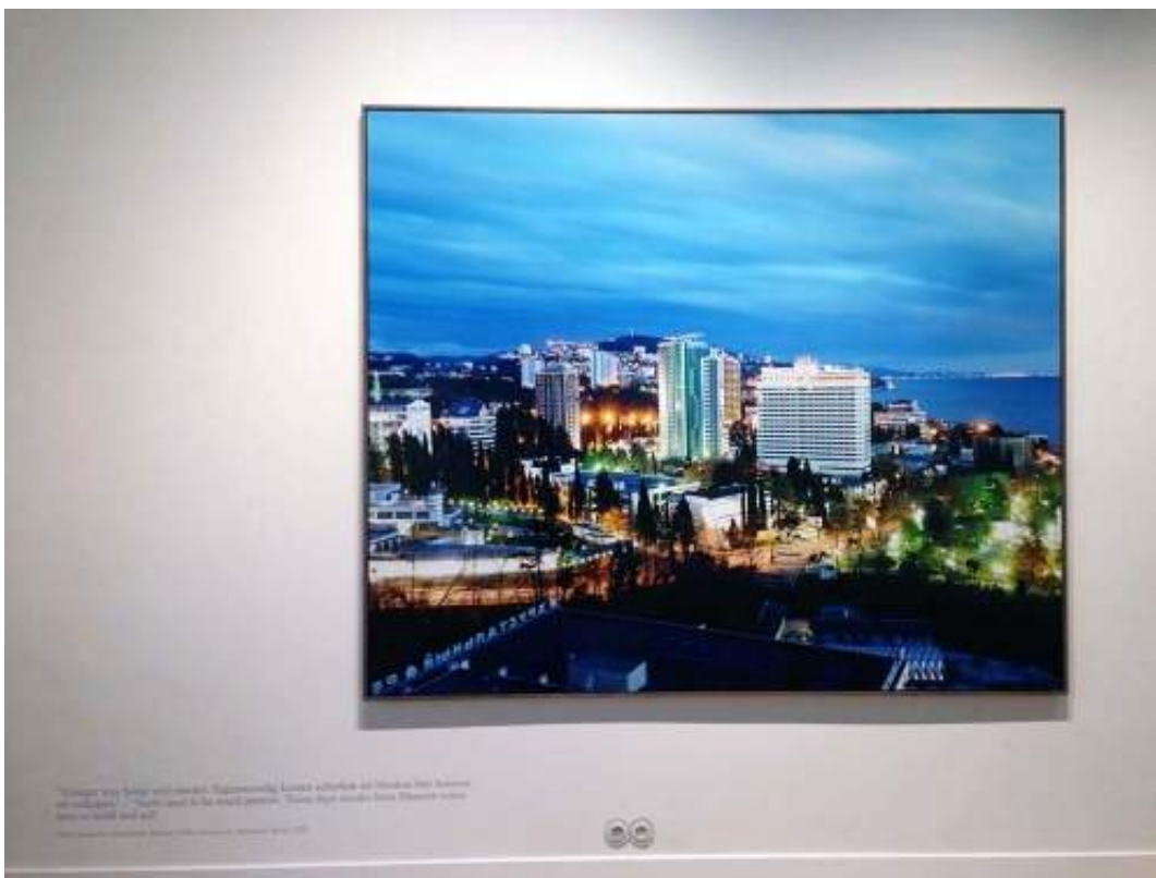
Sotsji, Rusland, 2011. Het bijschrift 'Lenings paleizen voor het proletariaat maken langzaam plaats voor de nieuwe paleizen voor speculanten en oligarchen'