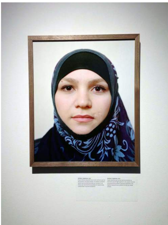
Derbent, Dagestan, 2012. "Ze beweert te hebben gezien dat de politie heimelijk een granaat in de kelder van haar familie had gelegd om daarna haar oudste broer te kunnen arresteren"