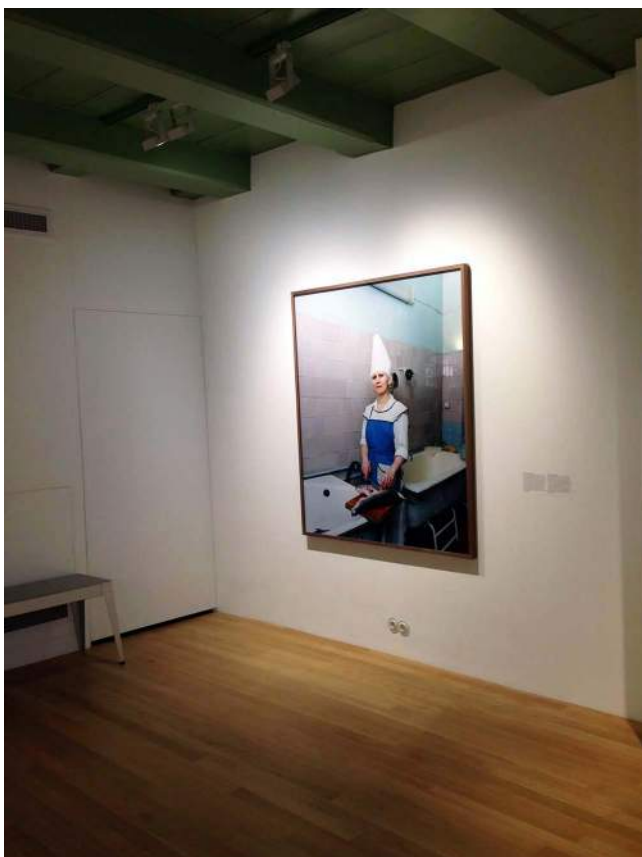
Angarsk, Rusland, 2008. Een werkneemster maakt vis klaar in de kantine van een cementfabriek.