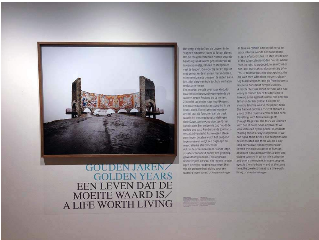
Begin van een nieuw hoofdstuk