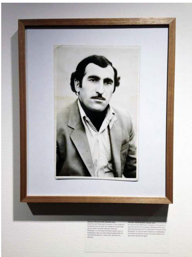
Tjermen, Noord-Ossetië, Rusland 2012. Deze 'bink van het dorp' ging in 2007 boodschappen doen. "Zijn auto werd leeg teruggevonden bij het politiebureau. Er is nooit meer iets van hem gehoord."