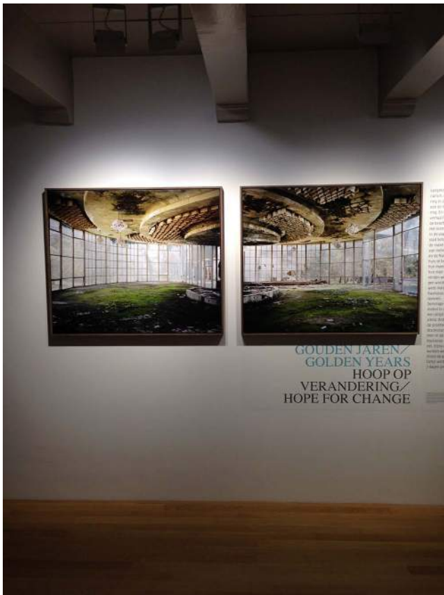
Pistoenda, Abchazië, 2010 (links) en 2013 (rechts)

Het is nog enigszins vertederend dat Hornstra in een natuurhistorisch museum in Teberda niet mag fotograferen met flitslicht, omdat de veren van opgezette vogels dan kunnen