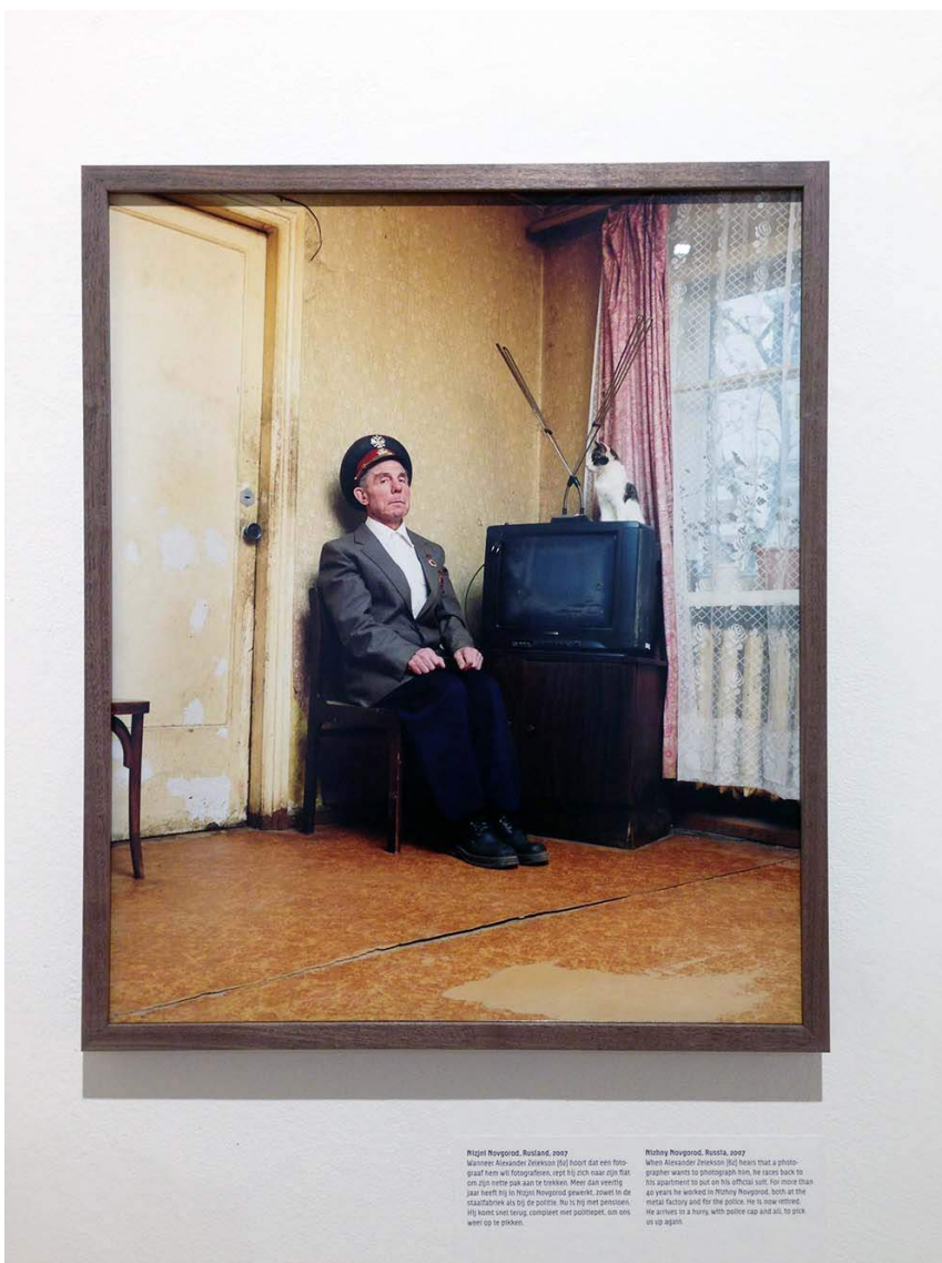
Nizjni Novgorod, Rusland, 2007. Deze gepensioneerde politieman trekt gauw zijn nette pak