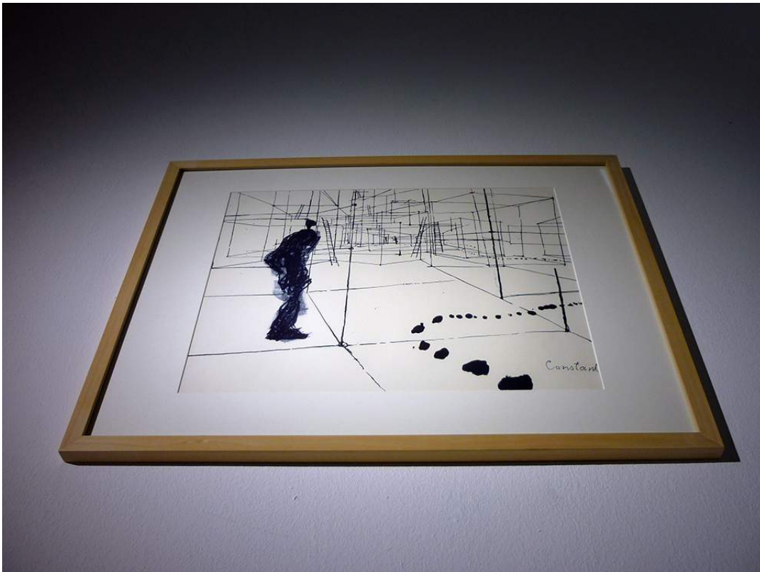
Constant, Labyrismen (detail) , 1968