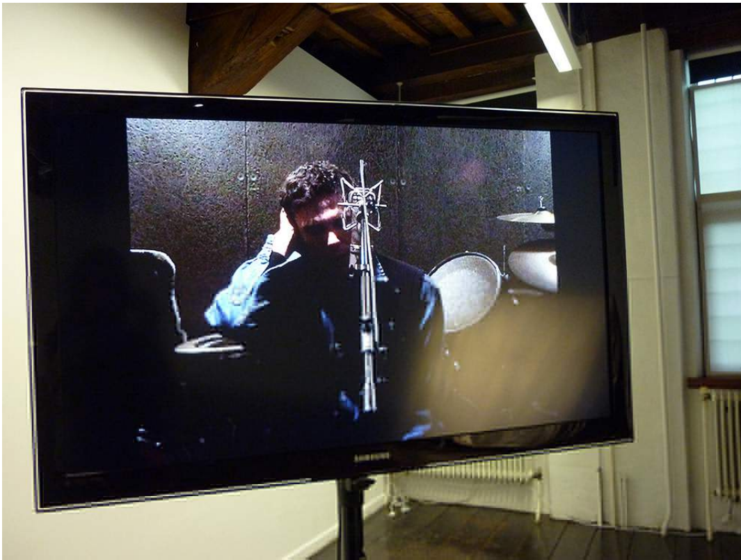
Anri Sala, Naturalmystic (Tomahawke #2) , 2002