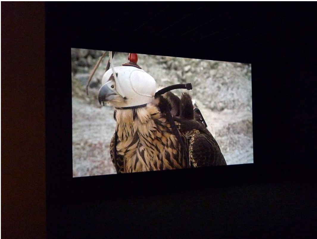
Laurent Grasso, On air , 2009