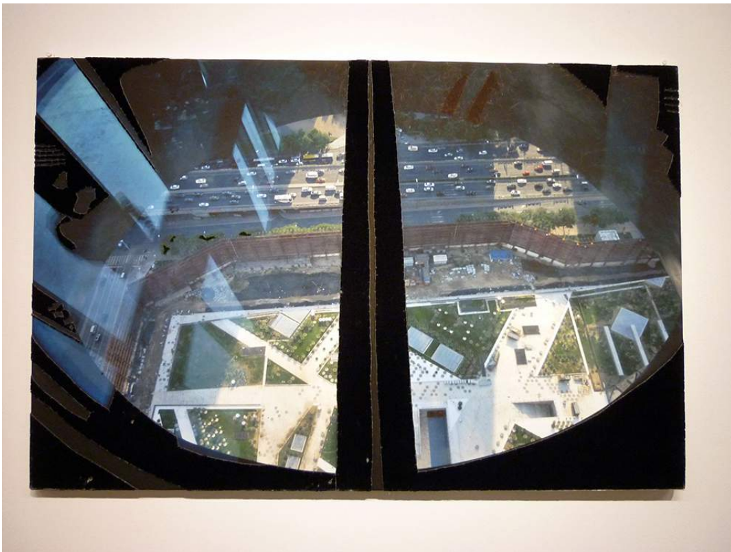
Berend Strik, Vicarious Atonement , 2011