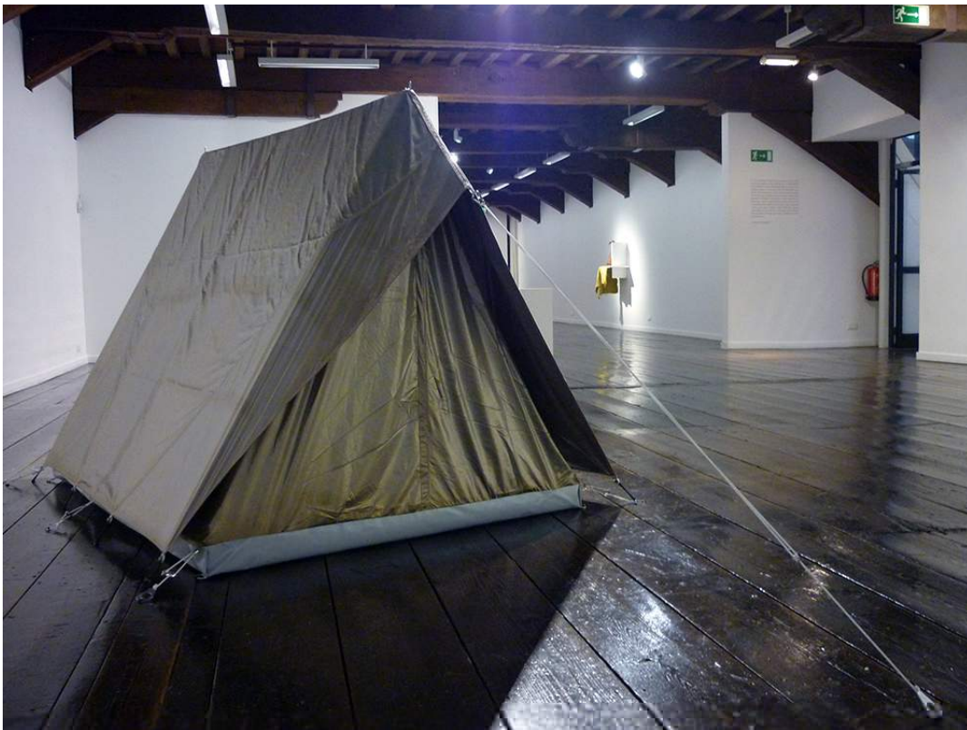
Sarah van Sonsbeeck, Faraday Tent , 2011