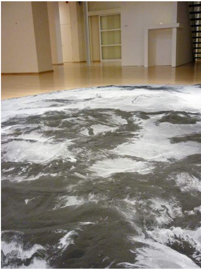
Roger Hiorns, Untitled , 2008