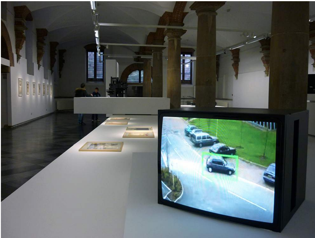
Timo Arnall, Robot readable world , 2012