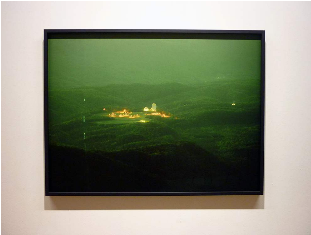
Trevor Paglen, They watch the moon , 2010